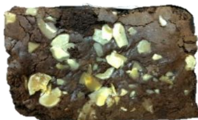
อัลมอนด์สไลด์มีส่วนปนมากเกินไป

2. ลักษณะที่ไม่สามารถยอมรับได้ (Rejected)