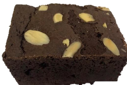
พบหน้าบราวน์ที่ลอก