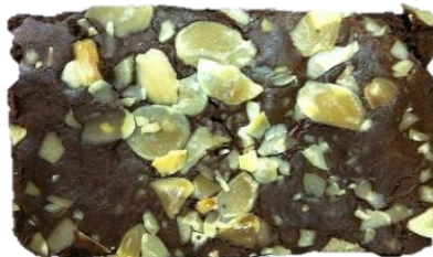
อัลมอนด์สไลด์มีส่วนปน ตามภาพ

2. ลักษณะที่สามารถยอมรับได้ (Accepted) (ต่อ)