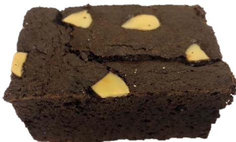
พบหน้าบราวน์แตก

2. ลักษณะที่ ไม่สามารถยอมรับได้ (Rejected) (ต่อ)